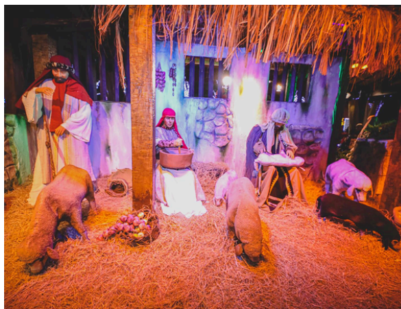
O Presépio Napolitano encanta novamente com seus 200 metros e peças em movimento

A Prefeitura de Santana de Parnaíba dará início ao Natal de Luz 2025 na próxima sexta-feira (5/12), às 19h, levando magia e encanto para toda a cidade. A programação inclui o maior presépio articulado do Estado de São Paulo, a estreia da Parada Natalina, mais de 700 mil microlâmpadas de LED na decoração, parque de diversões, cantatas, a Feira da Mulher Empreendedora e a tradicional Casa do Papai