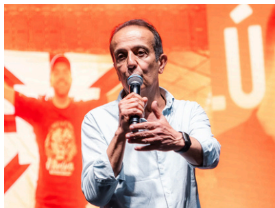
O ex-prefeito de Jundiaí, Miguel Haddad, é um dos apoiadores de Danilo Joan no interior