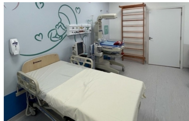
O Hospital Santa Ana completa 15 dias com 37 partos realizados e reforça seu compromisso

O Hospital e Maternidade Municipal Santa Ana (HMSA) completou 15 dias de funcionamento com 37 partos realizados, sendo 28 normais, 9 cesarianas — incluindo 2 de alto risco — e 4 prematuros. Gerido pela Agir, o hospital conta com um moderno Centro de Parto Normal (CPN), com três salas e uma equipe multiprofissional dedicada a oferecer atendimento humanizado e de excelência às mães e bebês de Santana de Parnaíba e região.