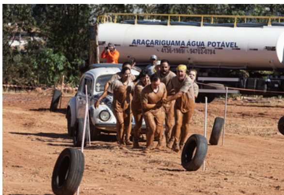
Adrenalina, superação e muita energia marcaram a Tróia Up Race 2025

Araçariguama recebeu mais uma vez a Tróia Up Race, em sua 2ª edição, na Etapa MIDDLE. O evento, que já se consolidou como uma das principais corridas de obstáculos da região, reuniu atletas amadores e profissionais de diversas cidades, movimentando o turismo esportivo e proporcionando uma experiência intensa de resistência física e mental. Com 6 km de percurso e 20 obstáculos desafiadores,