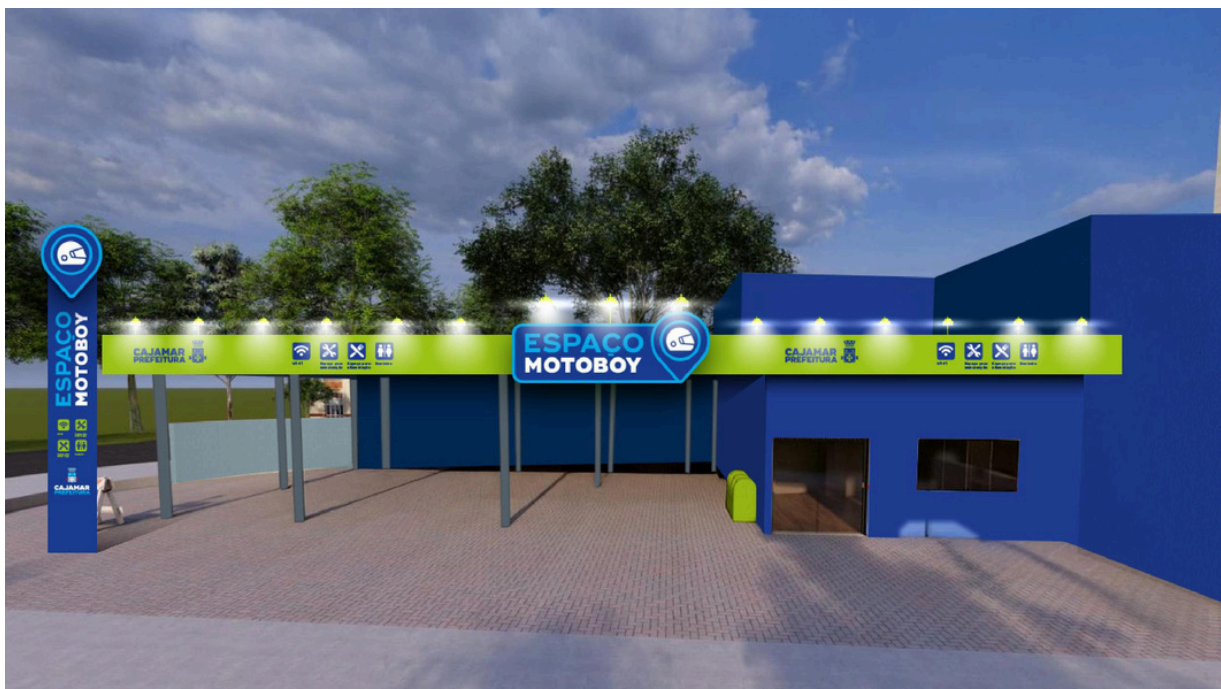
Prefeito Kauan Berto apresenta o futuro Espaço Motoboy em Cajamar, com estrutura moderna e acolhedora para valorizar os trabalhadores da cidade

O novo espaço está sendo planejado para ser moderno, acolhedor e totalmente funcional, garantindo que esses profissionais tenham um ponto de apoio digno durante suas jornadas de trabalho. A