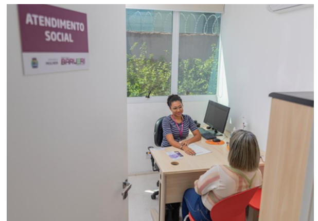
Entre as atividades, destaca-se um seminário no dia 12 de agosto

vidades, no dia 12 de agosto será realizado um seminário no Centro de Eventos de Barueri, reunindo especialistas e representantes da rede de proteção para discutir os avanços e desafios dessas leis. Além disso, entre os dias 4 e 29 de agosto, o hall da Secretaria da Mulher receberá a intervenção "Elas Estavam Aqui", com sapatos vermelhos simbolizando vítimas de feminicídio, para promover uma reflexão sobre os impactos.