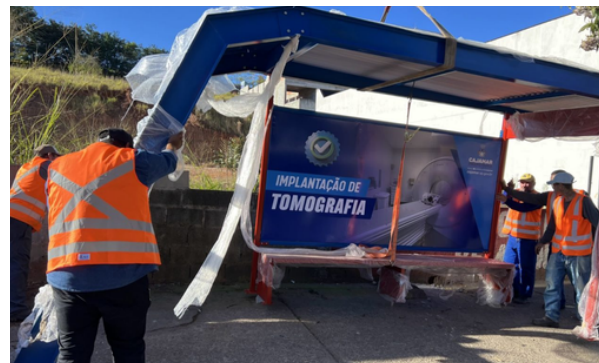
A ação será expandida para outros bairros nos próximos dias em Cajamar

A Prefeitura de Cajamar deu início à instalação de 100 novos pontos de ônibus em diversas regiões da cidade, reforçando o compromisso com a mobilidade urbana, o conforto e a segurança dos usuários do transporte público.