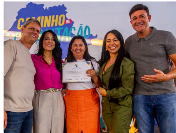
Formatura marca avanço na qualificação e geração de renda para a população

O programa, fruto da parceria entre a Prefeitura de Araçariguama e o Governo do Estado, tem como foco a qualificação profissional e geração de renda. A formatura, realizada em Ibiúna, reuniu 313 alunos de cinco municípios da região, destacando a relevância da capacitação regional para os municípios.