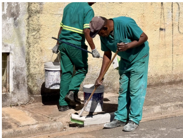
Segunda edição do programa já começou, com mutirão de melhorias

Além das intervenções físicas, o programa promove a escuta ativa dos moradores para atender suas demandas. No dia 23 de agosto, a prefeitura realizará um mutirão com serviços gratuitos de diversas secretarias no bairro Paraíso. O "Prefeitura no Seu Bairro" seguirá levando atendimento e melhorias a outros bairros, fortalecendo a participação da população.